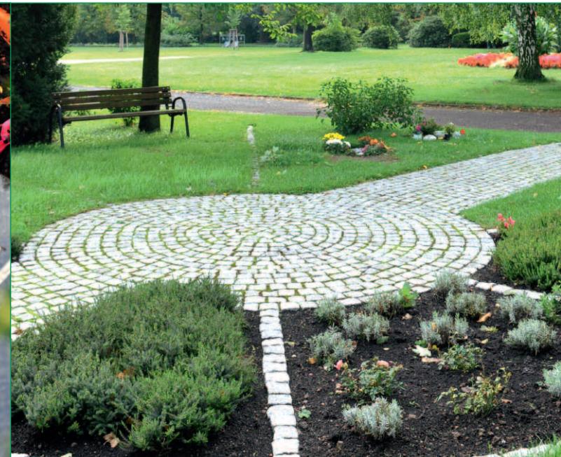
„Garten der Stille“

Sie haben einen Verlust der Schwangerschaft erlebt oder Ihr Kind wurde tot geboren.